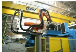
Robotyzacja w spożywcze najszybciej przebiega w pakowaniu i konfekcjonowaniu