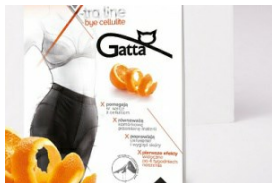
Justyna Steczkowska ponownie w reklamie rajstop marki Gatta