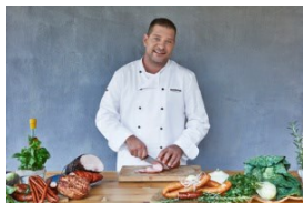
Uczestnik MasterChefa promuje wędliny Hańderek