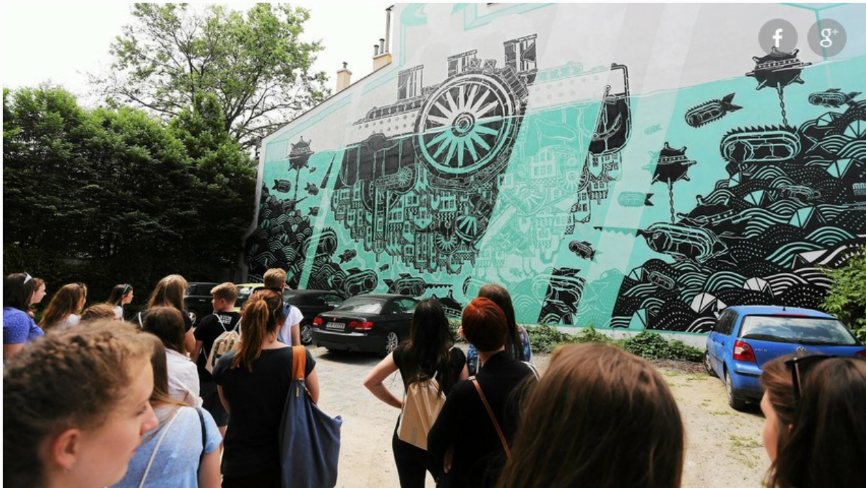
warto zobaczyć