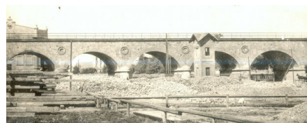
Dawne Aleje, mokradła na Grzegórzeckiej, mosty [ZDJĘCIA]

Wszystkie nasze artykuły znajdziesz na Twitterze , jesteśmy także na Facebooku . Dołącz do nas, dyskutuj i dziel się opiniami. Listy: redakcja@krakow.agora.pl