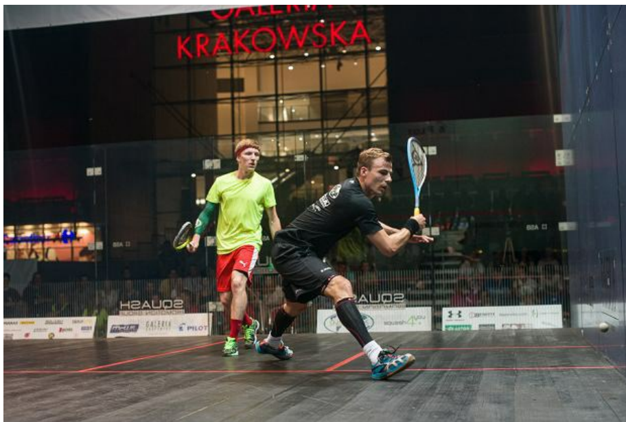
Nick Matthew podczas turnieju w Krakowie